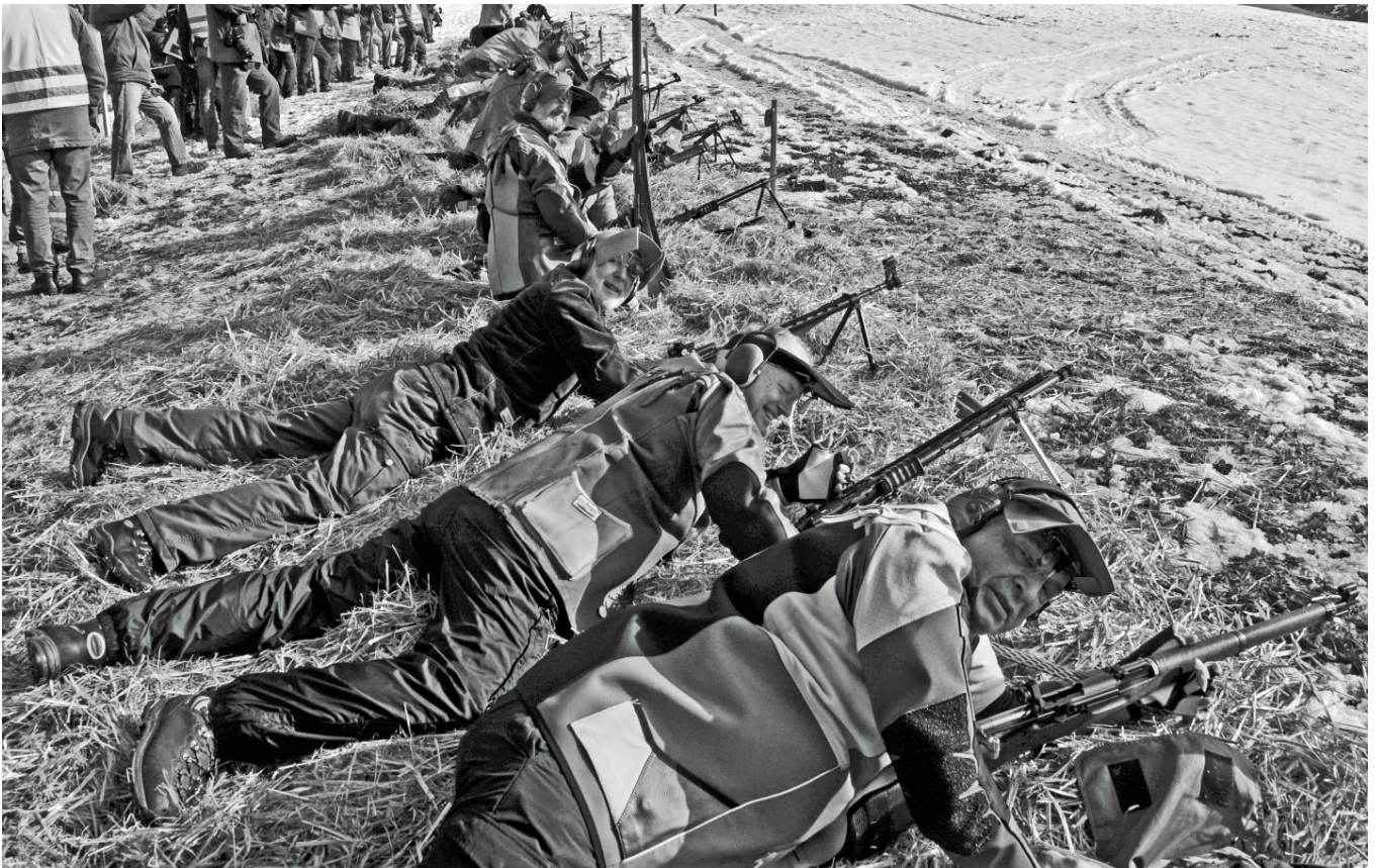
Bild: Gewehrschützen 300Meter am Morgarten